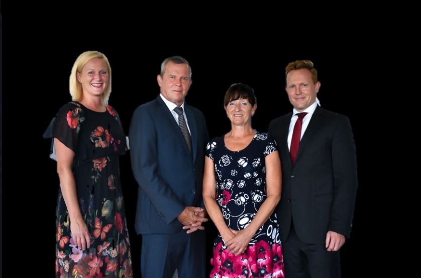
ŘÍDÍCÍ ORGÁNY SPOLEČNOSTI