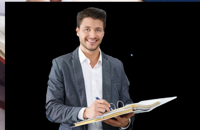
EXTERNÍ AUDITOR NEBO FIRMA