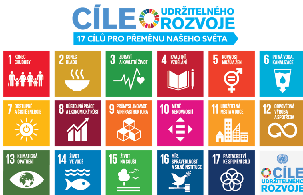
Obrázek 3: Cíle udržitelného rozvoje 12