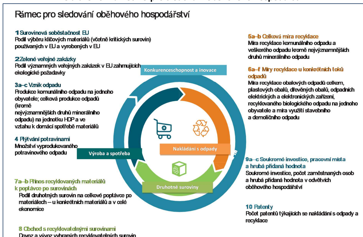
Obrázek 6: Rámec EU pro sledování oběhového hospodářství