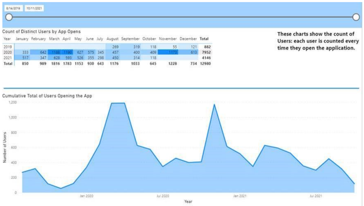
Graf 1: Používání aplikace v období 1.9.2019 - 11.10.2021

Zdroj: Interní materiály společnosti Vodafone Czech Republic a.s., 2021 71